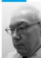
はせがわ きよし 長谷川 潔