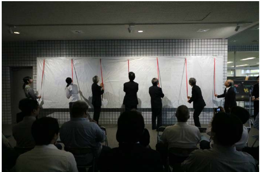
開学25周年記念レリーフの除幕